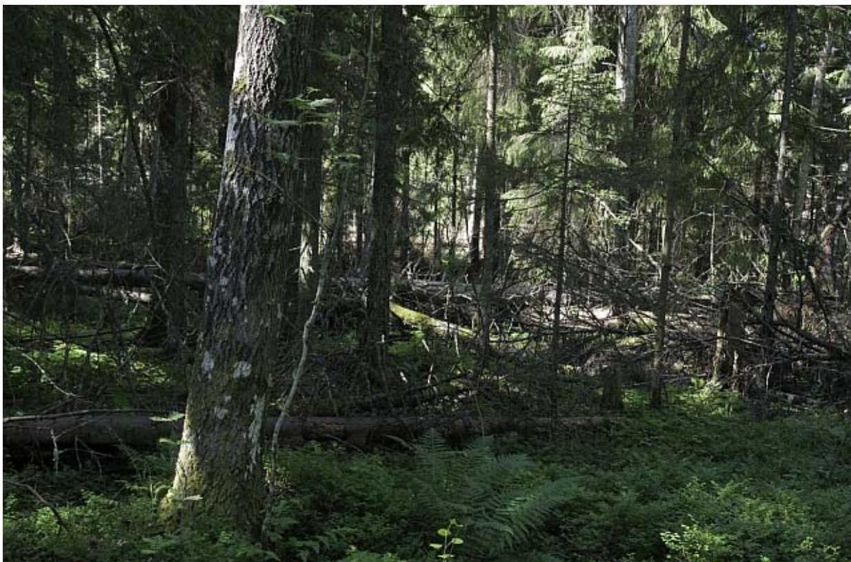
Kuva 1. Rehevässä sekametsässä on kohtalaisesti arvokasta lahoppua (JP)

Luontaisesti syntynyt kuusivaltainen metsäalue, jossa kasvaa sekapui- na rauduskoivua sekä jonkin verran haapaa, raitaa ja pihlajaa. Puusto on osin varttunutta. Aluskasvillisuudessa esiintyy lehtomaisen kan- kaan lajiston lisäksi paikoin vaateliaita lehtokasveja kuten kevätlin- nunherne, sinivuokko ja sudenmarja. Lehtokasvillisuus on kuitenkin keskimäärin niukkaa. Lehtopensaat ja jalopuut puuttuvat kokonaan.