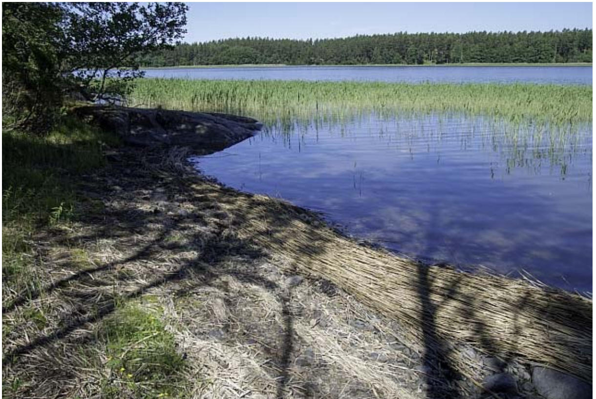
Kuva 2. Kapea, varjoisa rantakaistale on niukkalajinen (JP)

Metsäalueeseen nopeasti vaihtuva kapea ranta-alue, jossa jonkin verran niittykasvillisuutta. Kasvillisuutta ovat mm. tervaleppä, rantalampi, syysmaitiainen, pihaketohanhikki, rantapiharatamo ja jauhosavikka. Rannan edustalla kasvaa järviruokoa.